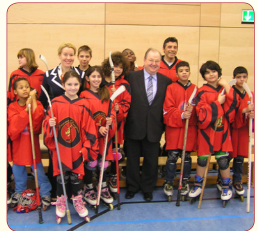
Die Schülerinnen und Schüler der Inlineskater-Hockey-AG freuen sich mit Schulstadträtin Giffey und Bürgermeister Buschkowsky über die neue Halle.

Neben der Sonnengrundschule haben die Turnhallen der Walt-Disney-Schule , der Schule am Teltowkanal und der Karl-Weise-Schule eine Komplettsanierung erhalten.