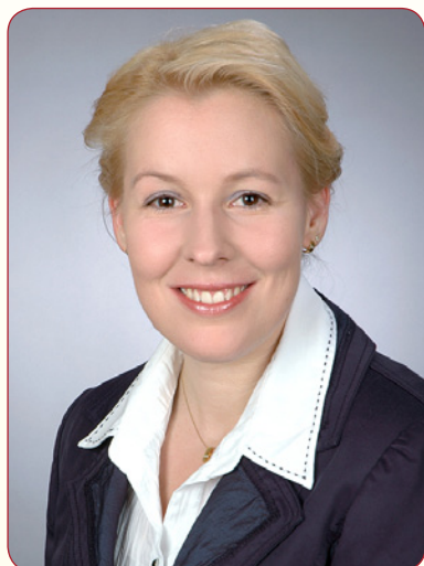
Dr. Franziska Giffey

Ihre Bezirksstadträtin für Bildung, Schule, Kultur und Sport informiert