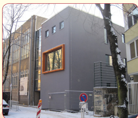
Am 17. Februar 2012 wird der moderne Erweiterungsbau der Hermann-Boddin-Schule eingeweiht.