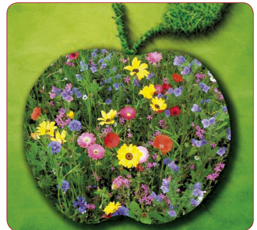
Ein bunt blühender Apfel wird zum Symbol des Schulgartenwettbewerbs (Gestaltung: Monika Küssner)