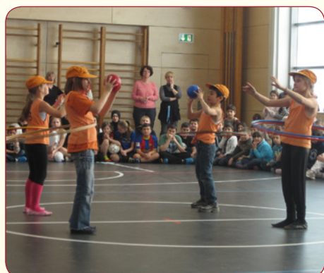
Am 10. Februar 2012 wurde die energetisch sanierte Turnhalle der Walt-Disney-Schule im Rahmen eines Schulfestes durch Schulstadträtin Dr. Franziska Giffey eingeweiht.